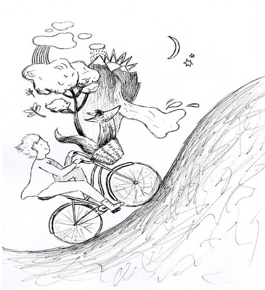
Il·lustració Tamara Hernández Ledesma