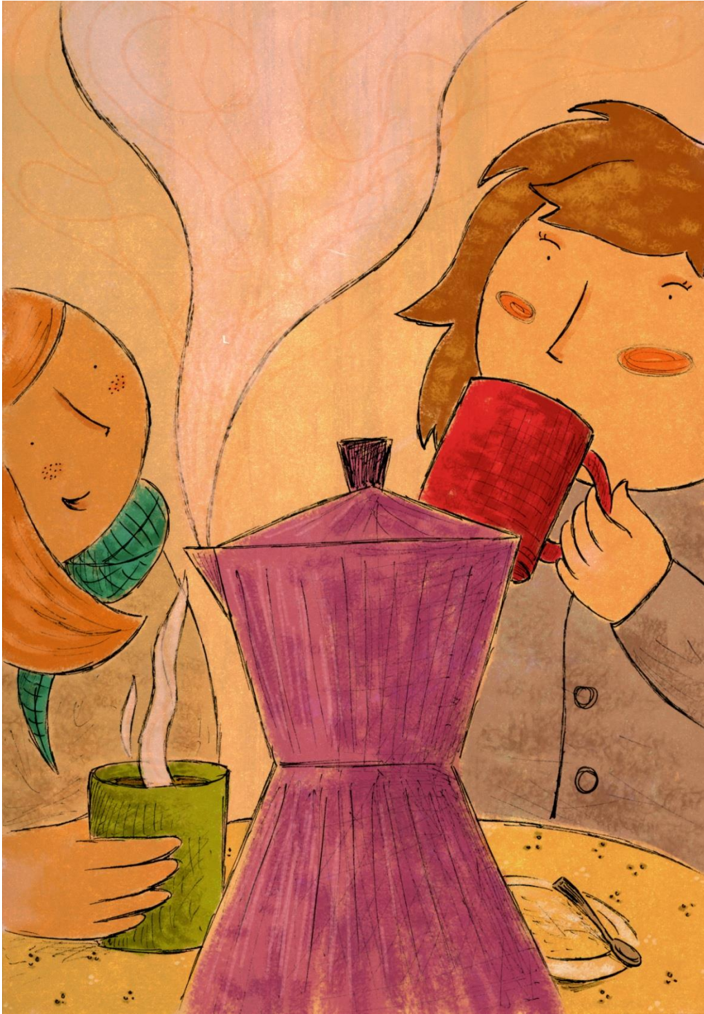
Il·lustracions de Tamara Hernández Ledesma